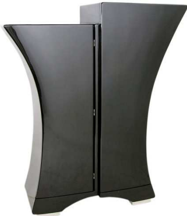
ABC Moderne-Pierre Cardin-Sculptural Black Lacq

Mettre en valeur ce meuble de Pierre Cardin, en réalisant une composition piquée de style linéaire à expression parallèle, se positionnant parfaitement sur cette création.