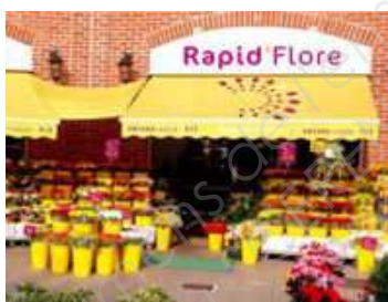
Un fleuriste Rapid Flore.

C'est l'enseigne Monceau Fleurs qui se révèle être la plus rentable des deux. Ses 30 meilleurs franchisés affichent une rentabilité nette de 5,54% en 2010 pour 949 000 euros de chiffre d'affaires. Les boutiques Rapid Flore sont de taille plus modeste. Les meilleures d'entre elles n'affichent que 426 000 euros de chiffre d'affaires et 4,66% de rentabilité.