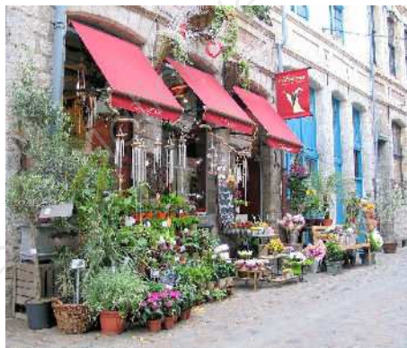
Un fleuriste lillois.

Le nombre de fleuristes est stable depuis 10 ans, même si on en compte 640 de moins. La profession semble moins touchée par la disparition des commerces de proximité. Le nombre de boutiques était de 15.453 en 1996. Il y en a 14.813 aujourd'hui (-4%). Pourtant le nombre de fleuristes avait progressé entre 2002 et 2005, avant de repartir à la baisse en 2006.