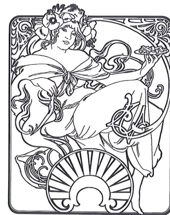
Calendrier pour "Biscuits Lefèvre-Utile"